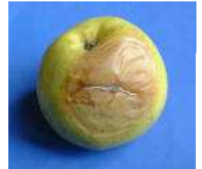
Pomme atteinte de penicillium expansum

Seul Penicillium peut contaminer les Pomaceae (pommes, poires et coings).